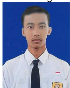
Juelleizes Christianso Redsvi Lobuia